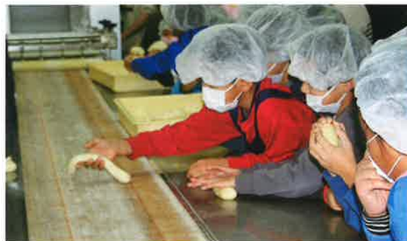
成形機から出てくるパン生地に興味津々