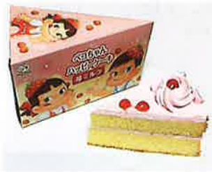
不二家 ペコちゃん ハッピーケーキ(苺ミルク)35g ふんわりスポンジに苺クリームをサンドした華やかなケーキです。 特定原材料等：小麦、卵、乳、大豆

3月、4月に向けて、桃の節句、進級、卒業、入学等のお祝い行事食をご案内しますので、ぜひご利用ください。