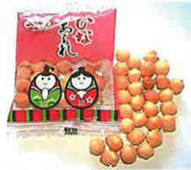
植垣 ひなあられ13g 厳選した国産餅米を使用しています。シンプルに塩のみで味付けています。 特定原材料等：なし