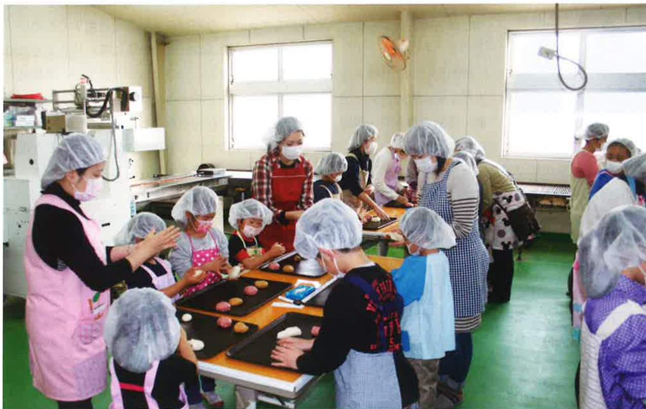
学校給食用パン工場親子体験会の風景 オリジナルのパン作りに挑戦!! (詳細は4・5頁に記載)

第111号 平成28年1月29日 編集・発行 公益財団法人 愛媛県学校給食会 〒790-0063 松山市辻町12番29号 ☎ 089-924-7623 FAX 089-924-6304