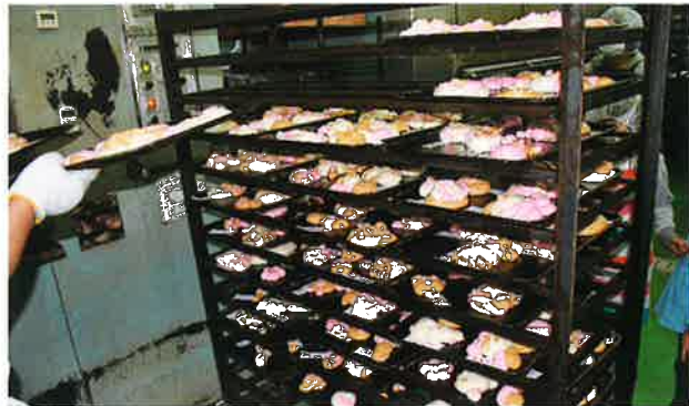
みんなが作ったパン生地が、間もなくオーブンへ