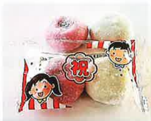
港製菓 紅白祝大福(20g×2粒入) 紅白とも粒あん入りです。 特定原材料等：大豆