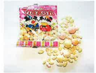
でん六 ひなあられ10g やさしい甘さのひなあられです。天然着色料を使用しています。 特定原材料等：小麦