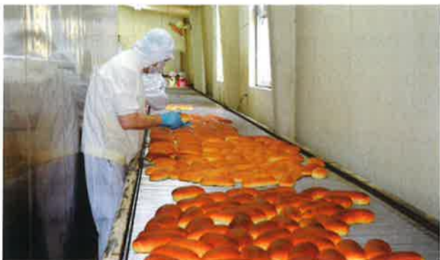
パンに異常はないか？ 表も裏も点検！