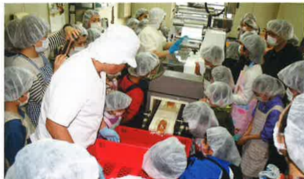
包装機・金属探知機にビックリ!!