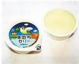
ネージュ 卒業すだちゼリー40g 徳島産すだち果汁を使用し、卒業生が「巣立つ」お祝い用に企画された商品です。 特定原材料等：なし