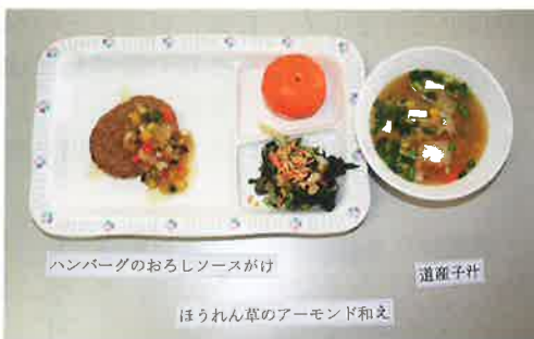
冷凍食品を使用したメニュー 3品