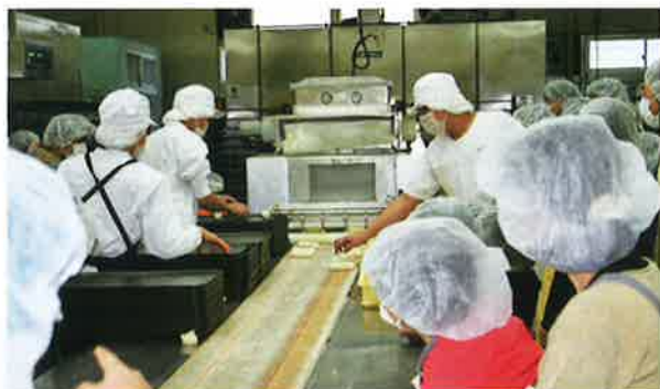
成形されたパン生地がコンベアで送られる

県内産みかん果汁を水の代わりに使用したパンです。平成15年度、学校給食会独自に開発したほんのりみかん色で酸味が特徴のパンです。