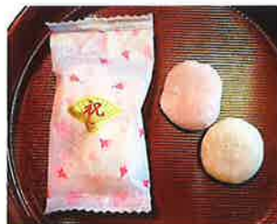
カセイ食品 紅白祝大福(20g×2粒入) 紅白とも粒あん入りです。 特定原材料等：大豆