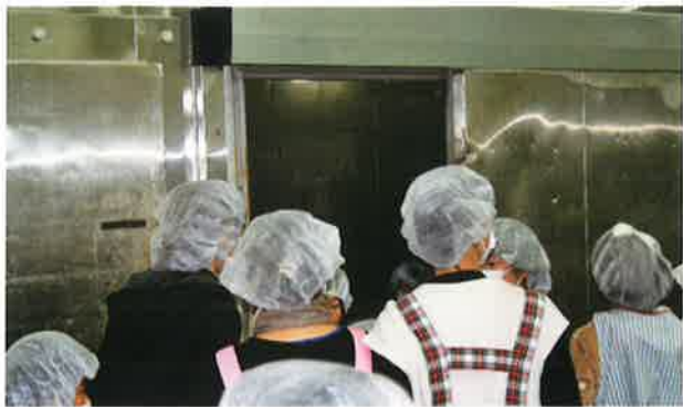
ホイロ（発酵室）の中は、室温47℃、湿度85%!! いざ、ジャングル体験へ