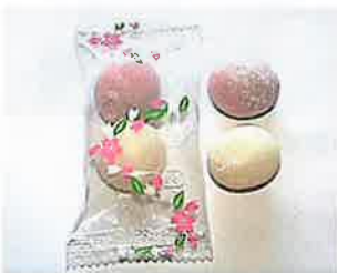
野口食品 紅白大福(桜柄)(10g×2粒入) 紅はこしあん入り、白は白あん入りです。 特定原材料等：大豆