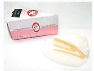
フランドールケーキ各種 NBホワイトボンブ、NBチョコボンブ、NBイチゴボンブ(各28g) 特定原材料等：小麦、卵、乳、大豆