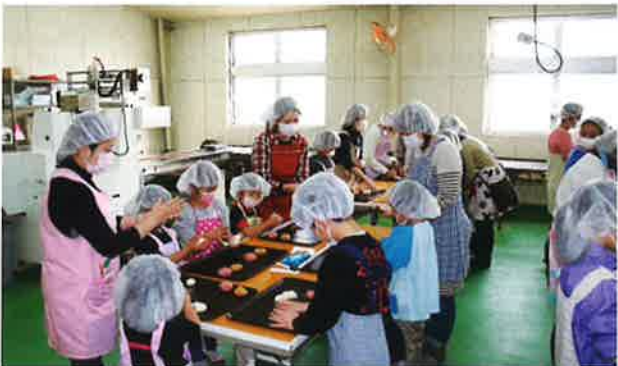
テーブルに分かれて、みんなでパン作り