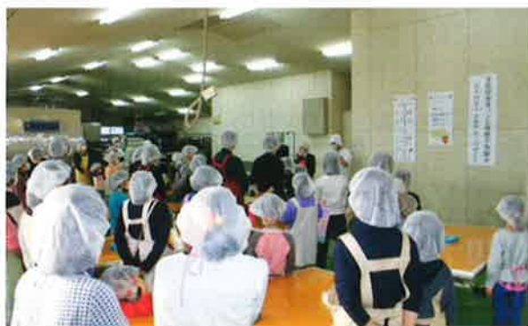
開会あいさつの様子

年も押し迫った12月26日の朝9時30分、親子体験会がはじまりました。日頃、見ることのない大きな機械や製造ラインに流れてくる多くのパン生地やパンに見入る子どもたちの眼差しには、焼きあがったばかりのアツアツのコッペパンよりも熱いものを感じました。また、親子でオリジナルのパン作りでは、思い思いのパンを作っていました。参加されたみなさん、出来映えはいかがだったでしょうか。その様子をご覧ください。