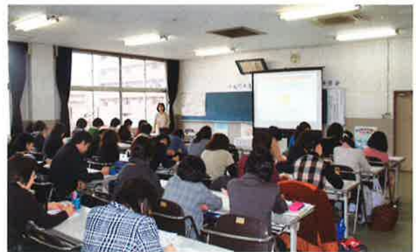
パワーポイントによる講義の様子