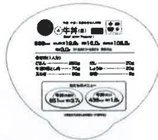
牛丼 (並) ウラ