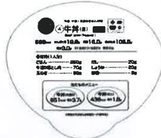
牛丼 (並) ウラ