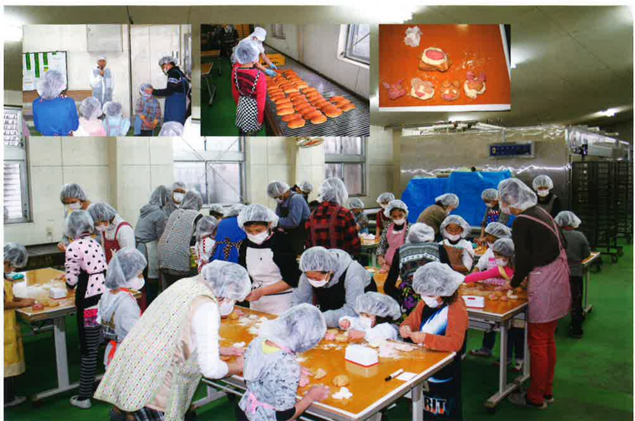
学校給食用パン工場親子体験会風景

第107号 平成26年1月15日 編集・発行 公益財団法人 愛媛県学校給食会 〒790-0063 松山市辻町12番29号 ☎ 089-924-7623 FAX 089-924-6304