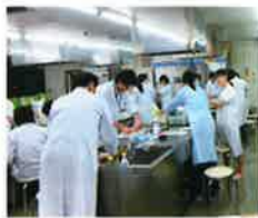
検査を行う会場の様子

食器のでん粉の残留検査はヨウ素溶液（市販のヨードチンキを蒸留水で5倍に薄めたもの）で行い、脂肪の残留検査は0.1%クルクミン溶液0.1gをエタノールで溶かし、100mlにしたもので行った。