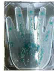
もやしを触って水洗いだけの手に残る大腸菌群検査