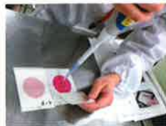
ペトリフィルムによるまな板の洗浄効果を確認するための大腸菌群の検査