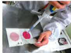
ペトリフィルムによるまな板の洗浄効果を確認するための大腸菌群の検査