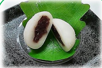
① 柏餅 (粒餡・疑似葉) 30g