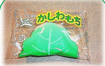
③ 柏餅 (柏葉なし) (粒餡) 30g