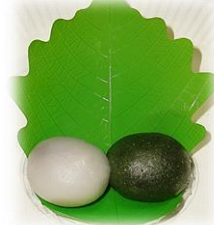
② なかよし柏餅 (粒餡・疑似葉) 15g×2個