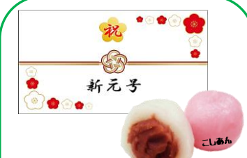
⑨ 祝だんご (新元号) 20g×2

こしあんをたっぷり使用した祝だんごです。30年ぶりに日本の元号が新しくなります。良い時代にりますよう、元年をお祝いしましょう。