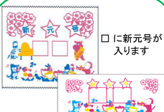
⑧ 愛媛県産和紙無添加海苔 (新元号タイプ)