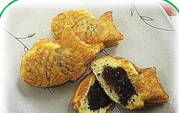
⑥ プチたい焼き 30g