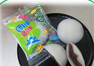
⑤ ミニ柏餅 (柏葉なし) (こし餡) 30g