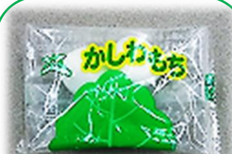
④ 柏餅 (柏葉なし) (粒餡) 10g×2個