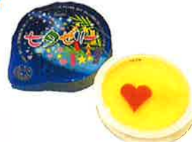
③七夕ゼリー (常温商品) 50g (紙スプーン付き)