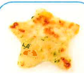
⑪あおさ入りイカステーキ(星形) 40g 50g