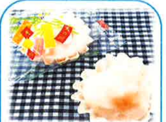
④キラキラ餅(みかん) 40g