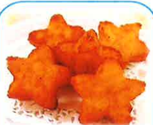
⑨SNF北海道星型ポテト 1kg

北海道産ポテトで作ったかわいい一口サイズの星型ハッシュポテトです。(1袋約100個入り)