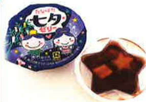
②冷凍七夕ゼリー (巨峰) 40g (紙スプーン付き)