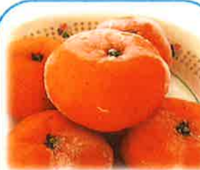
⑥愛媛県産冷凍みかん S玉