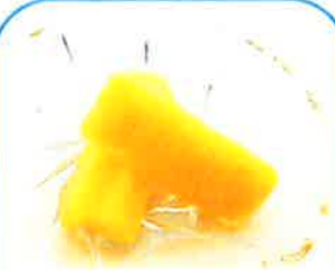
⑤冷凍パイン M (フィリピン産) 約40g