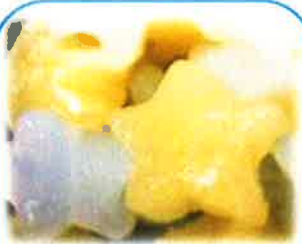
①星型ナタデココ&パイン 1kg袋